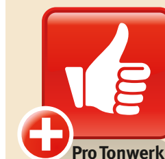
Design: GAAN Gabriela Vetsch, André Riemens