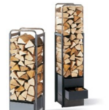
Élément de rangement en acier H 100-160cm B 32cm T 36cm