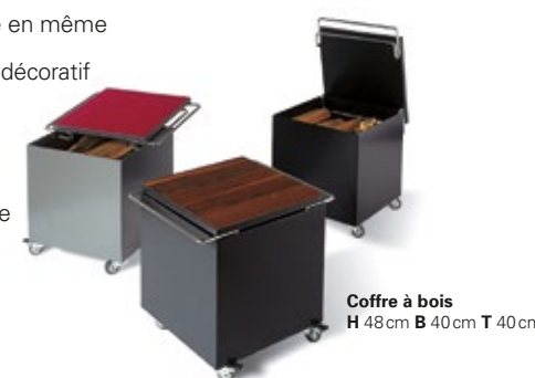
Coffre à bois H 48cm B 40cm T 40cm