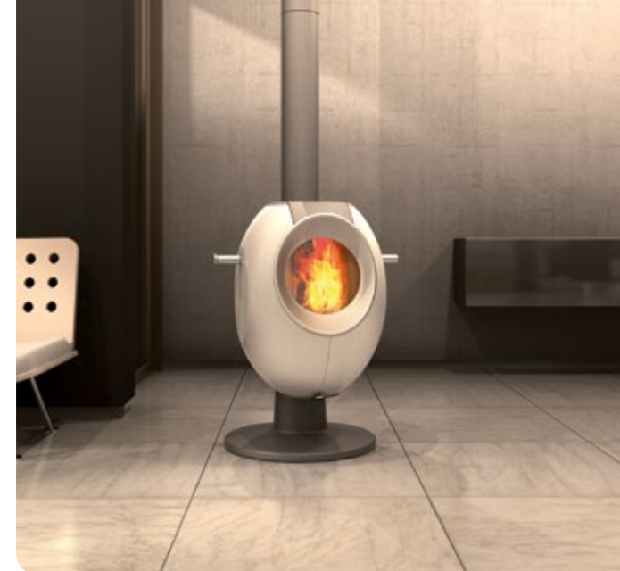
Design: GAAN Gabriela Vetsch, André Riemens