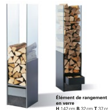
Élément de rangement en verre H 142cm B 32cm T 37cm

Quiconque préfère entreposer discrètement son bois de chauffage devrait plutôt opter pour la boîte en bois discrète. Ainsi, il peut ranger son bois et les accessoires de balayage dans des compartiments séparés, et il dispose en même temps d'un tabouret décoratif dont le couvercle est revêtu d'un placage de bois ou d'un feutre coloré.