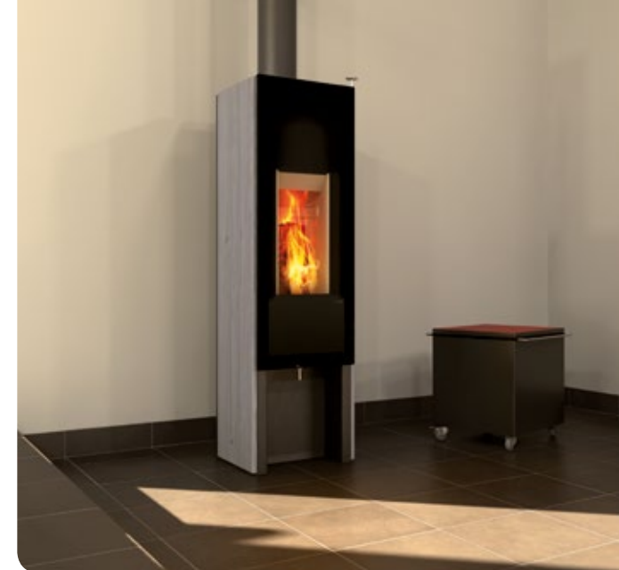
Design: GAAN Gabriela Vetsch, André Riemens