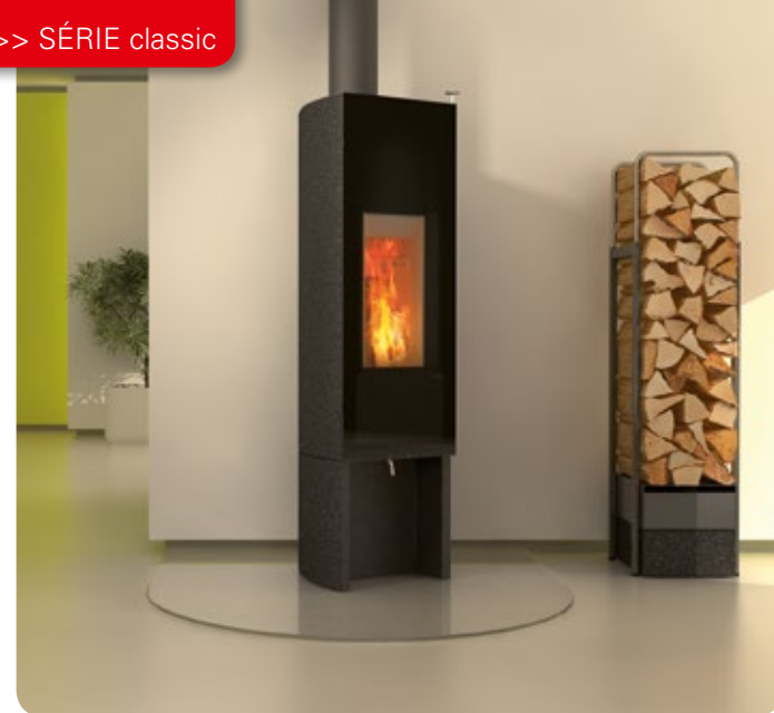
Design: GAAN Gabriela Vetsch, André Riemens